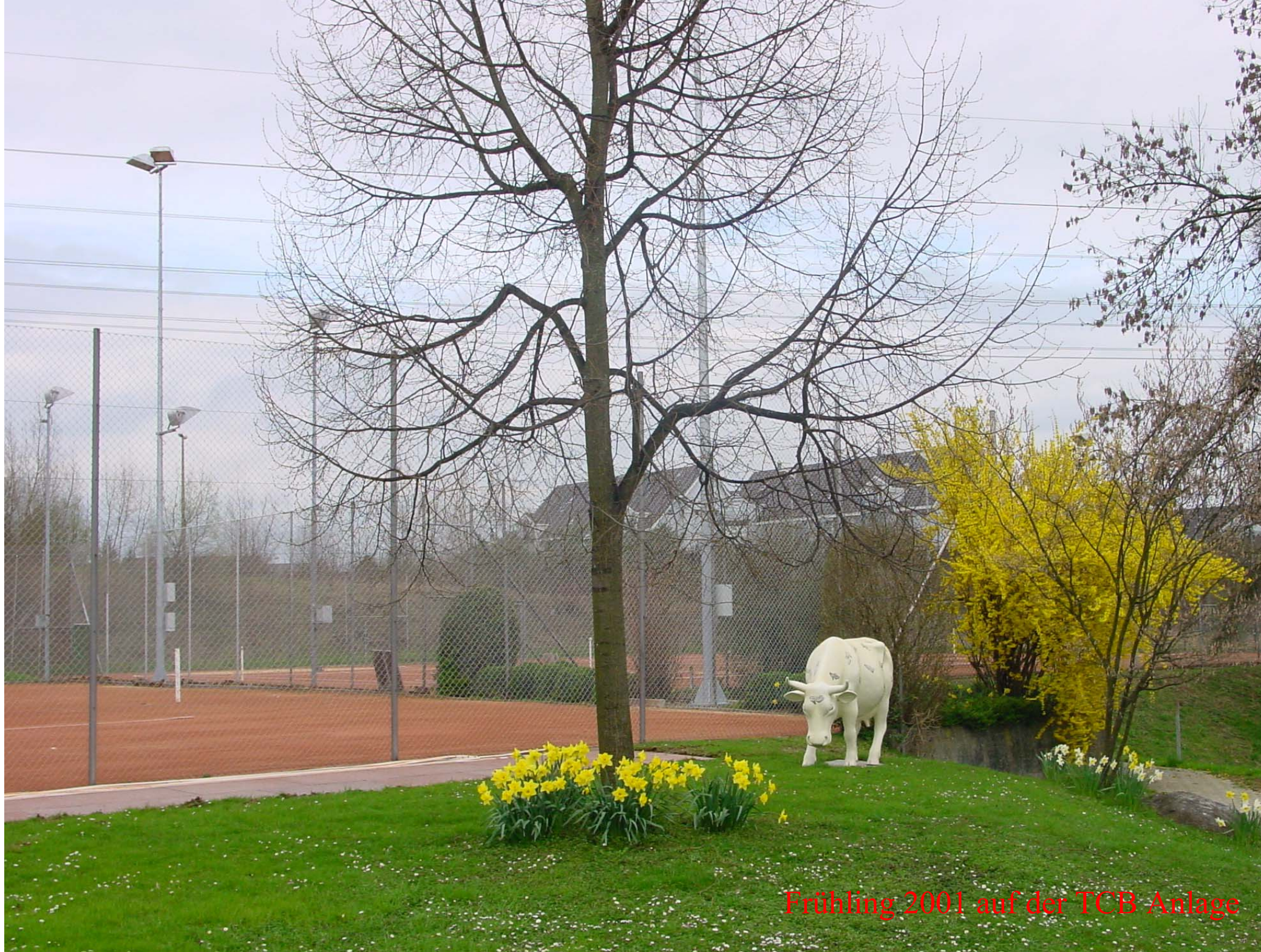
Frühling 2001 auf der TCB Anlage